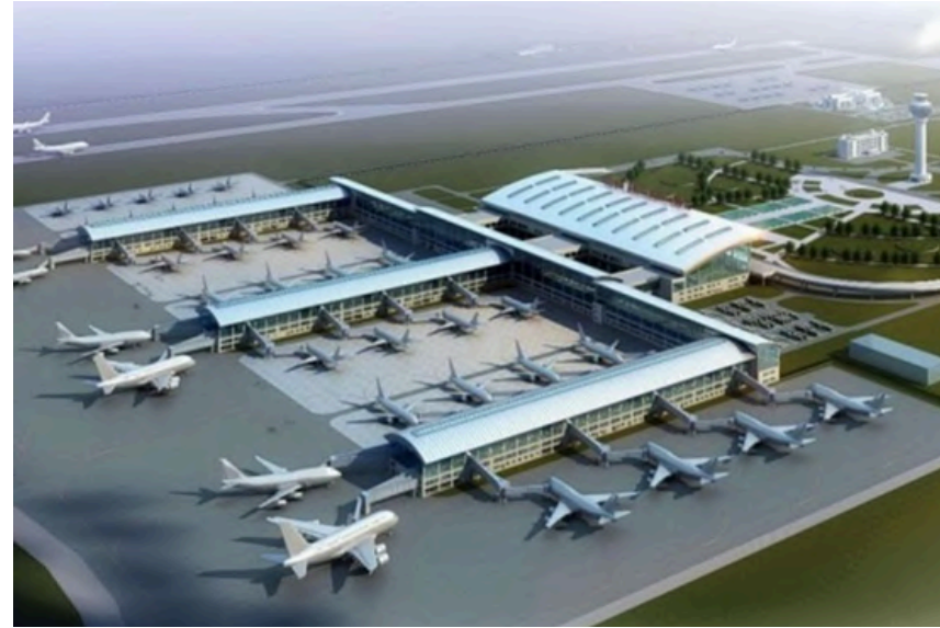
Project Name: New International AirPort Country: Angola