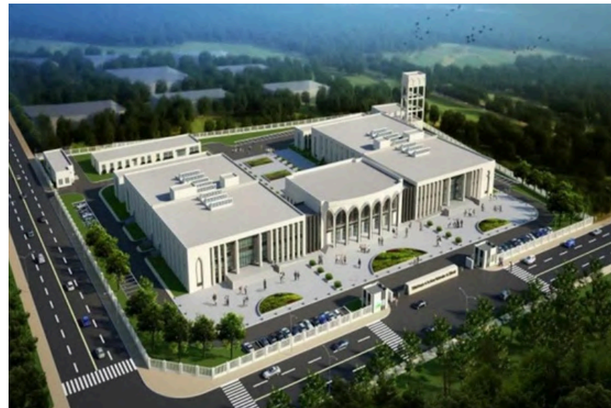
Project Name: National Library and Archives Country: Djibouti