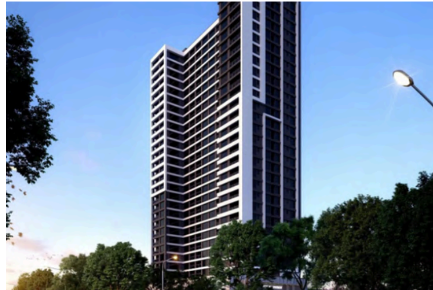
Project Name: Misty spring Country: Kenya