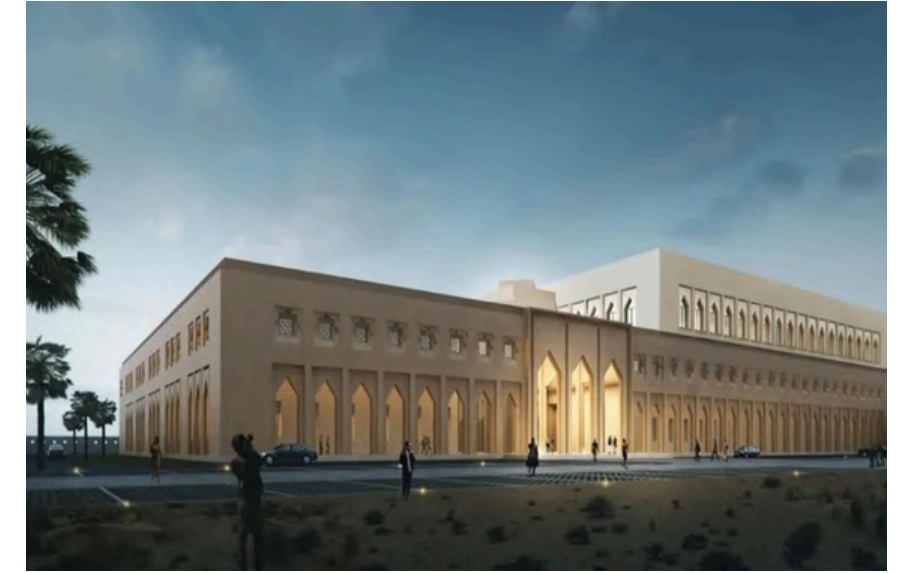
Project Name : National Institutes of Public Health project