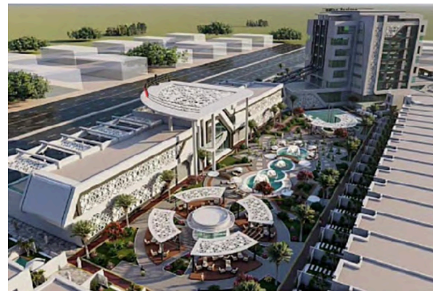
Project Name : Ajyal New Address MALL Country: KSA Dammam