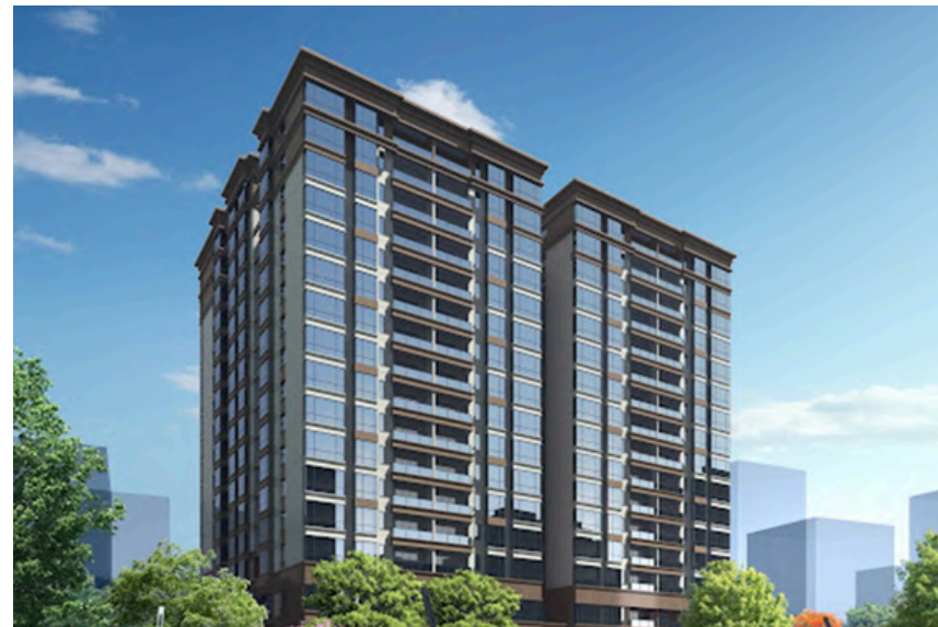
Project Name: RIVERSIDE ONE