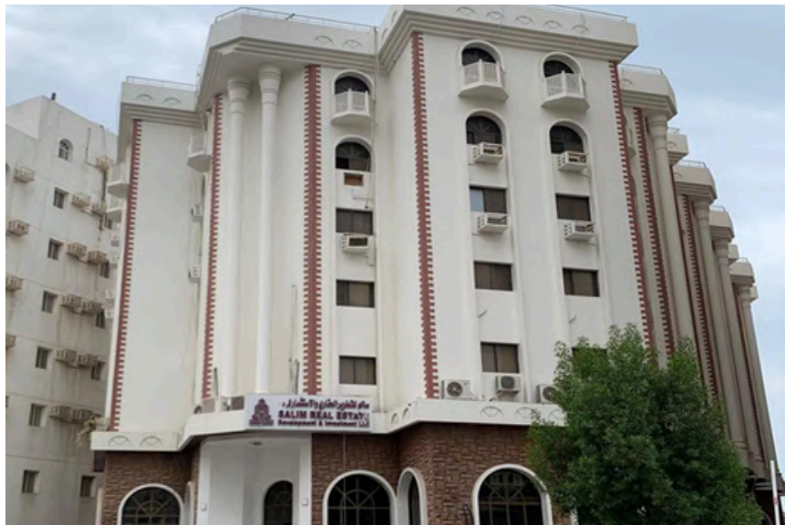
Project Name : SALIM REAL ESTAE