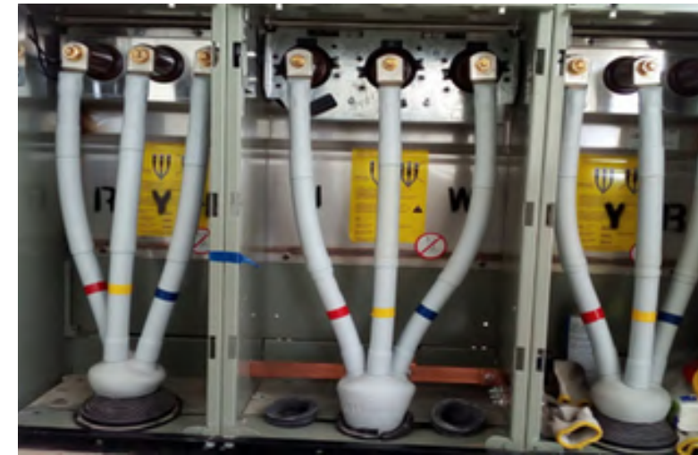
Terminations & Joints