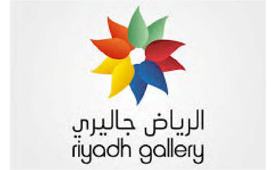
Project Name : Riyadh Gallery Country: KSA Riyadh