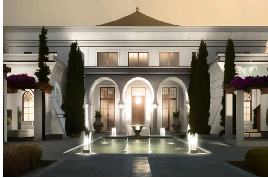
Project Name : Prince Mohamed Bin Salman (Charlette) Palace Country: KSA Jeddah