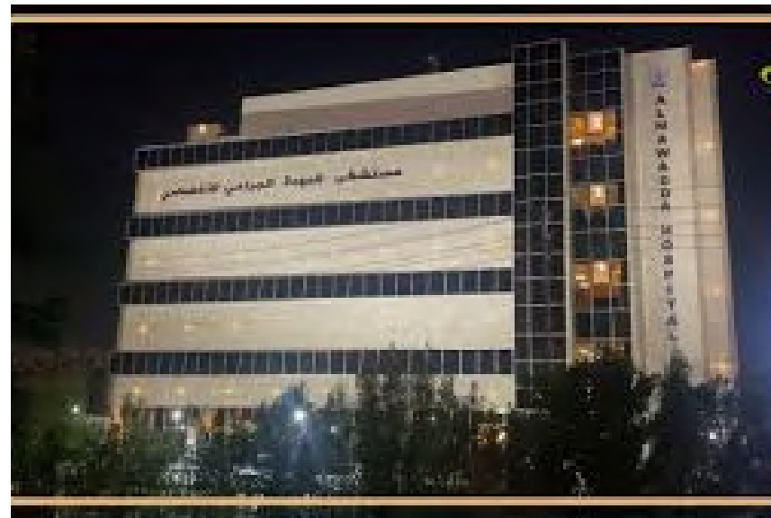
Project Name: AlMoudah Hospital