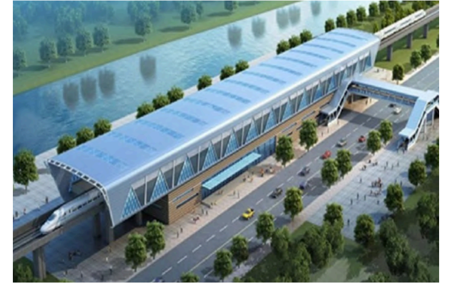
Project Name : Light rail Country: Angola