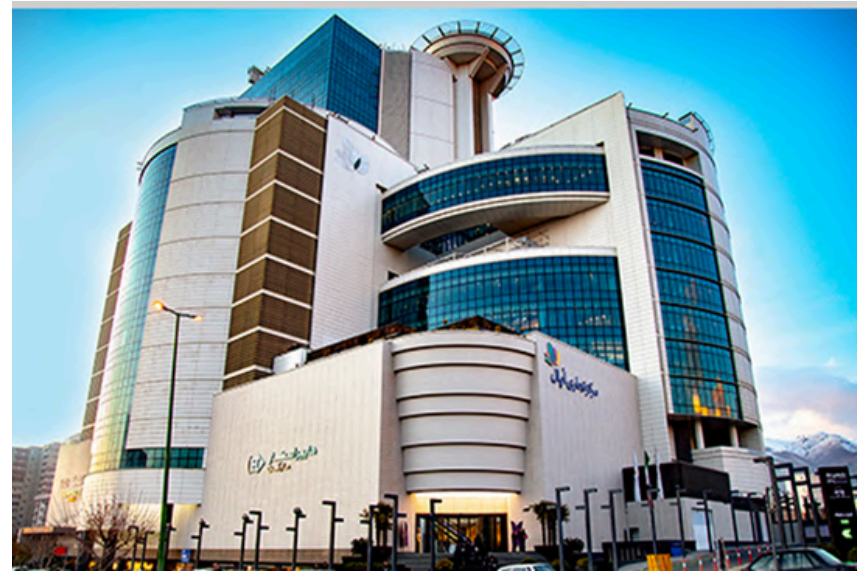
Project Name: Opal Shopping Center