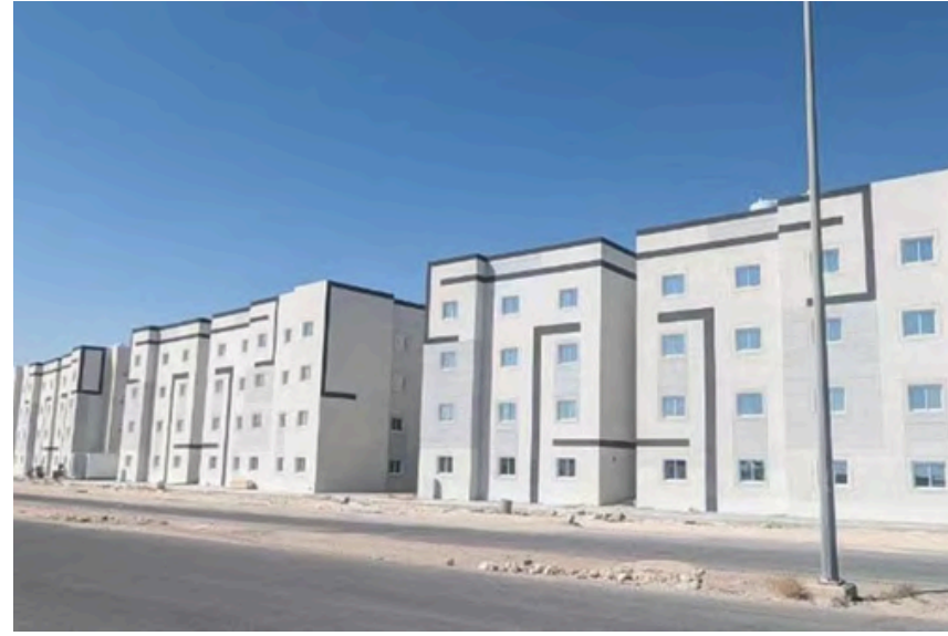
Project Name : RABIAT ALEHSAA HOUSING