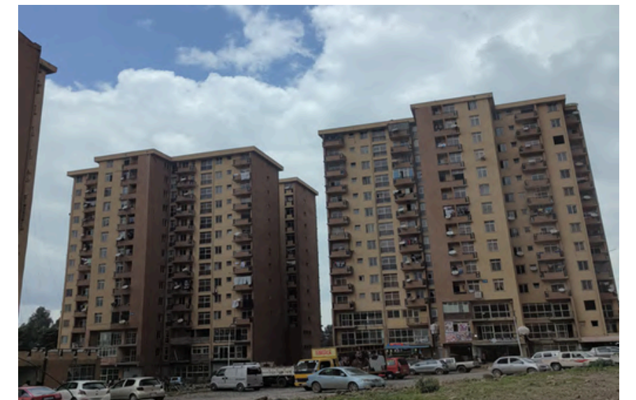
Project Name: Addis Ababa Housing Development & Administration Bureau (AHDAB) Country: Ethiopia