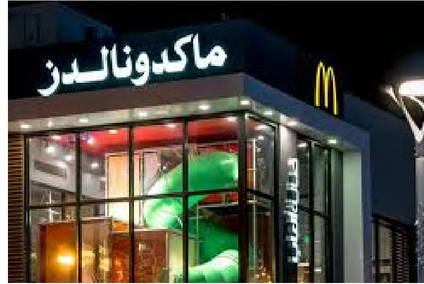
Project Name : McDonald's branches Country: KSA