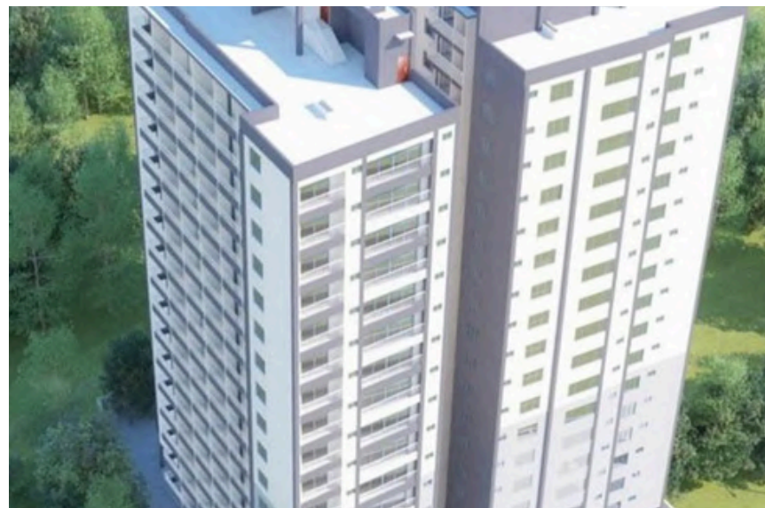
Project Name : Winchester Garden Country: Kenya