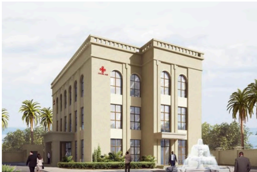
Project Name : Urban Security Monitoring Building Country: Djibouti