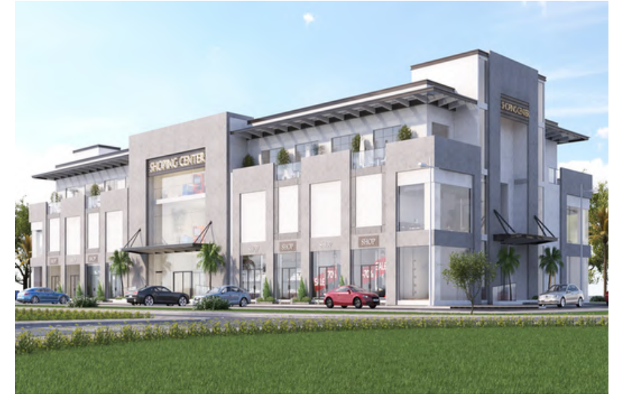
Project Name : HE MALL