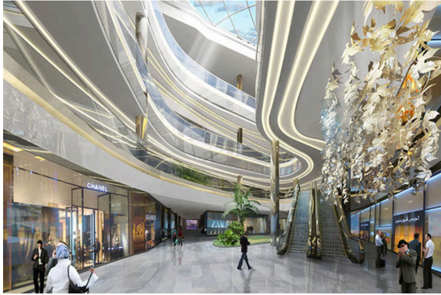
Project Name : Terhan Mall