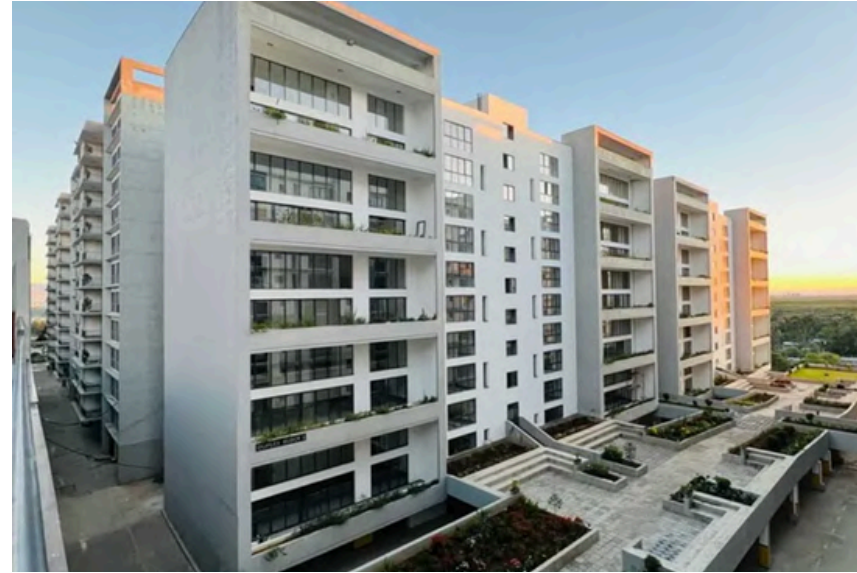
Project Name: Federal Housing