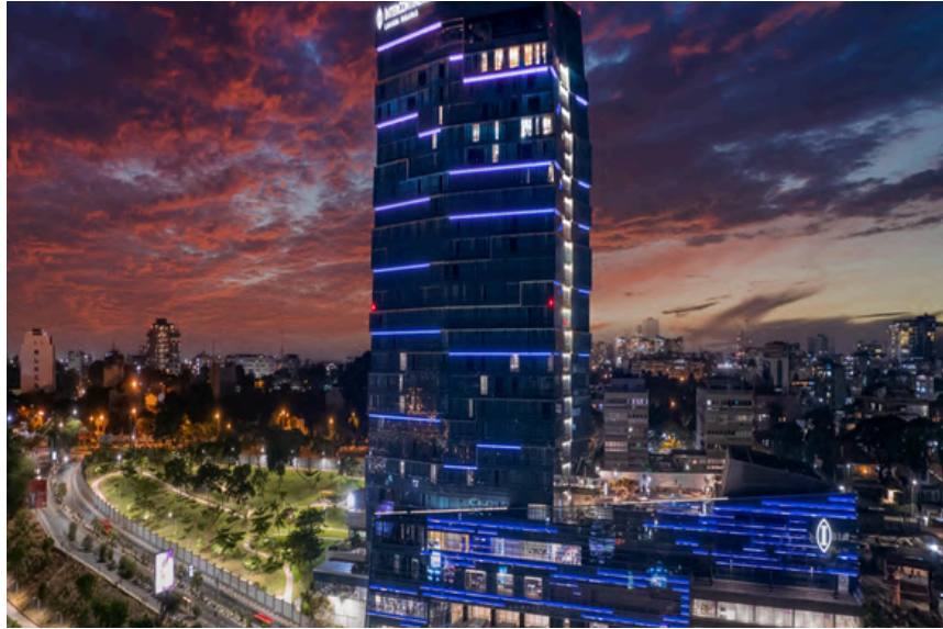
Project Name : Intercontinental hotel Country: Angola