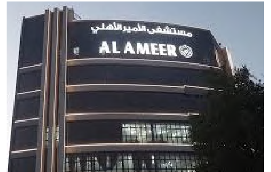
Project Name: AL AMEER Hospital