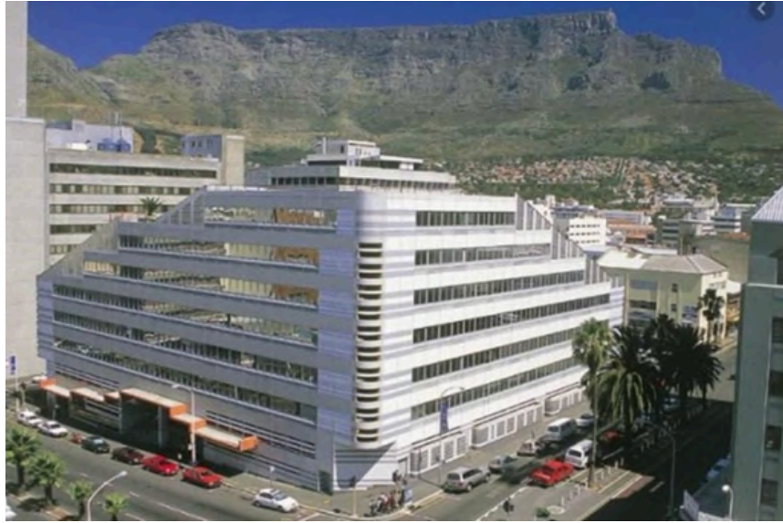
Project Name : Adowa Ellis Park Student Village