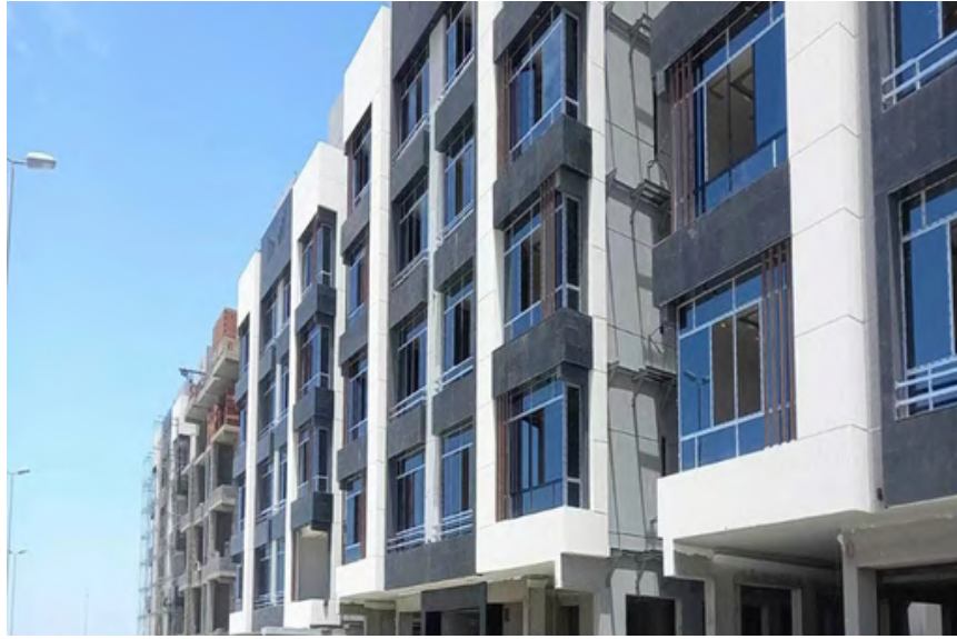
Project Name : RAWAYA CONSTRUCTION