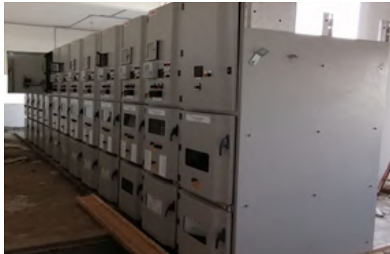
MV & LV Switchgear