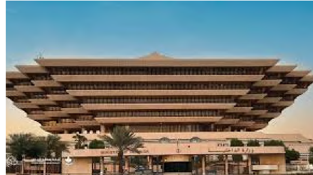
Government & Semi Government