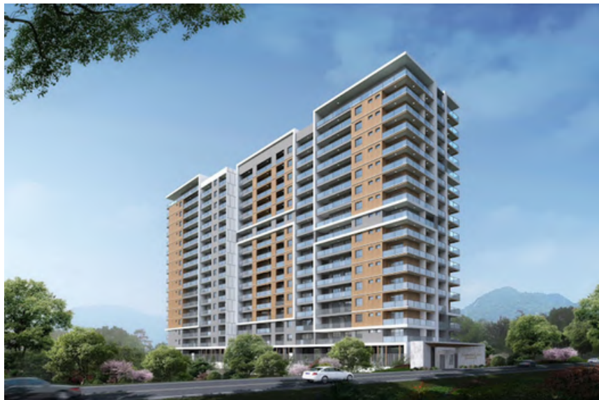
Project Name : Diamond Ivy