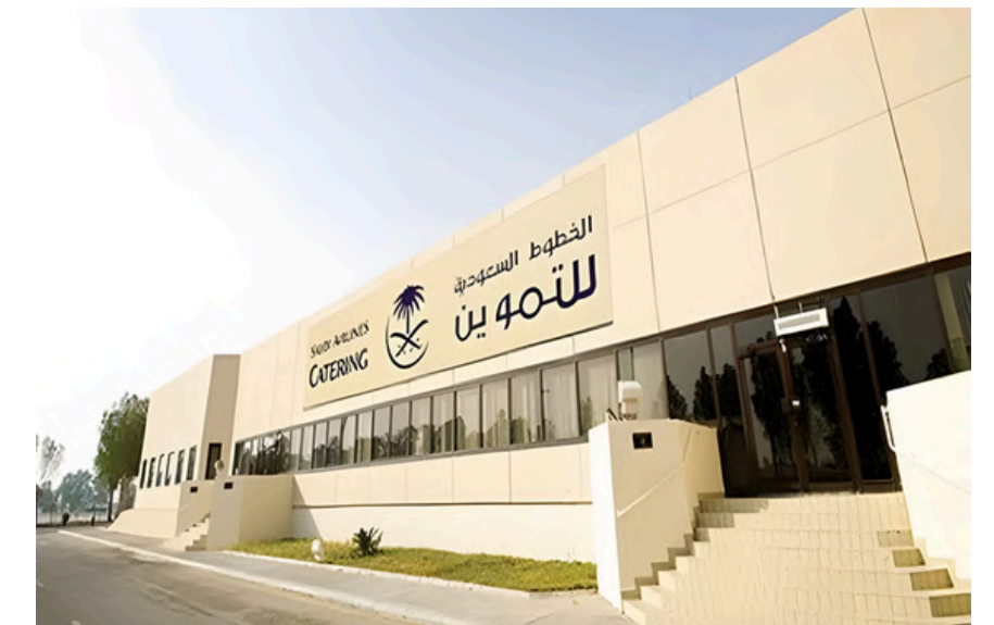
Project Name : Saudia Catering Complex Country: KSA Jeddah