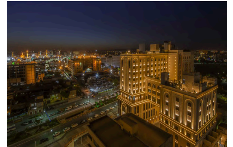
Project Name: Madineh Aljavad Hotel