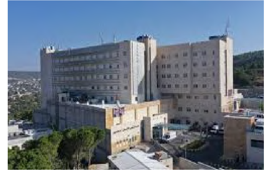
Project Name : AL-EMAN HOSPITAL