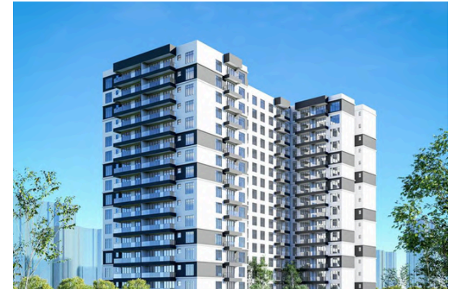
Project Name : Kaisa Ventures Orchid residency Country: Kenya