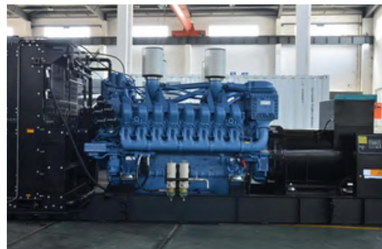
MV/ LV Generators