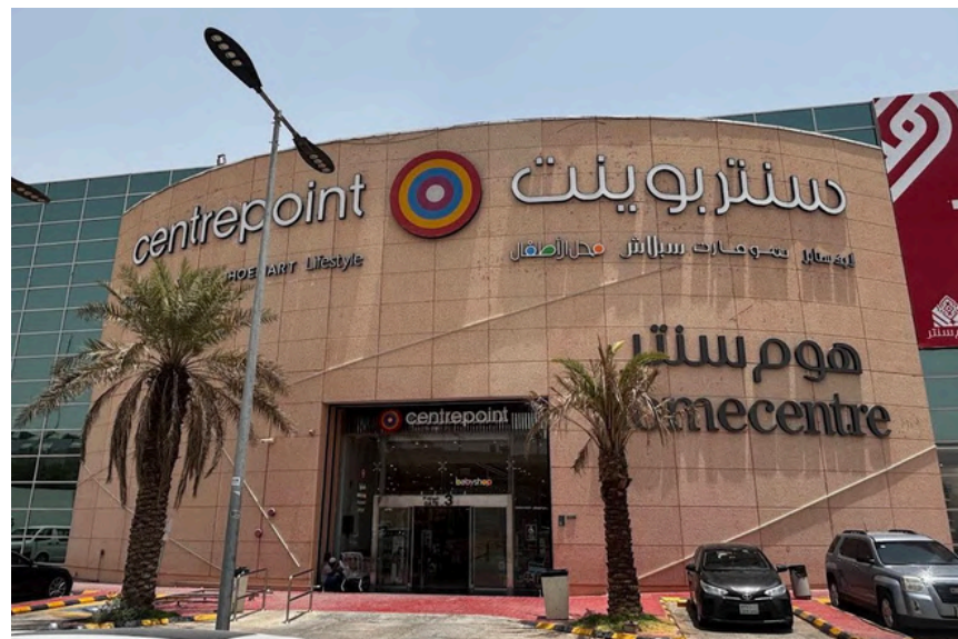
Project Name : Centrepoint Country: KSA Riyadh