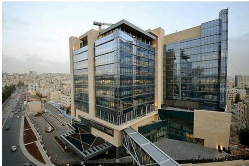
Project Name : Al-Husaini Medical Complex