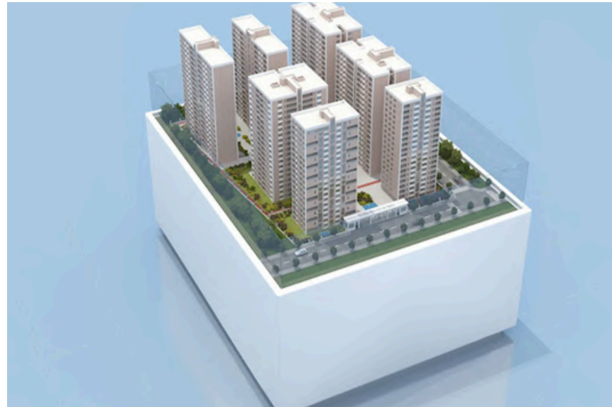
Project Name : Royal Legend Country: Kenya