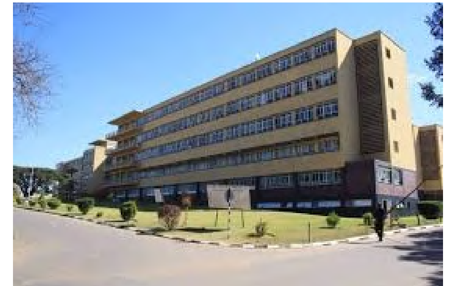
Project Name: Kitwe Central Hospital Country: Zambia