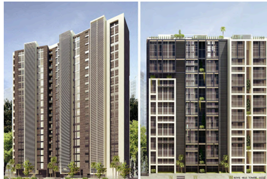
Project Name : ROYAL HILLS