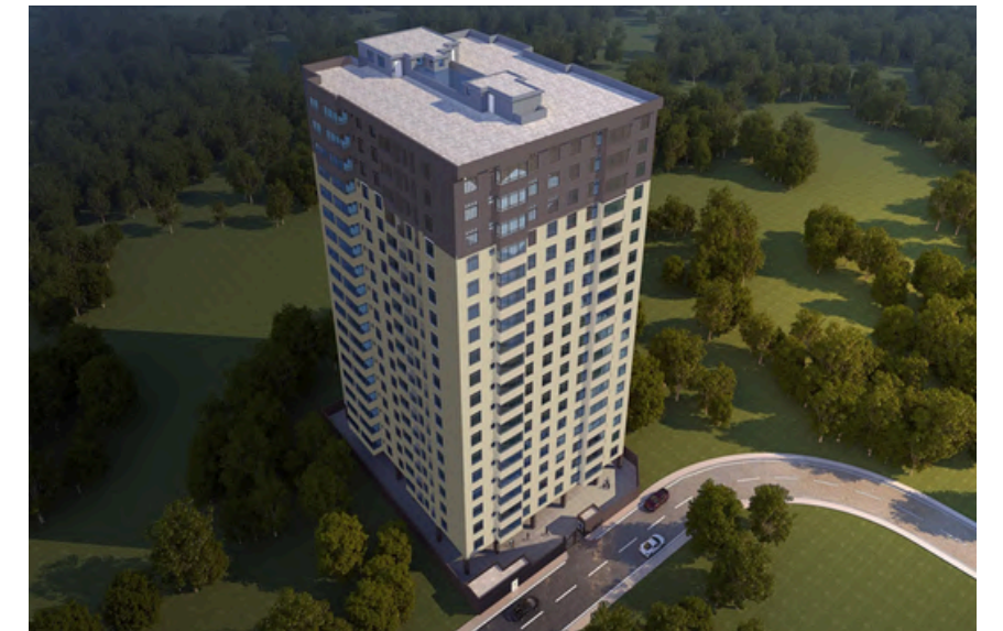
Project Name: Adorn Homes Apartments