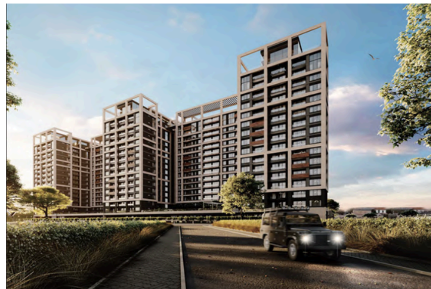
Project Name: South park Country: Kenya